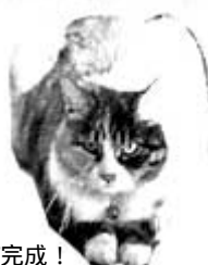
枠線の色を 「なし」にして完成！