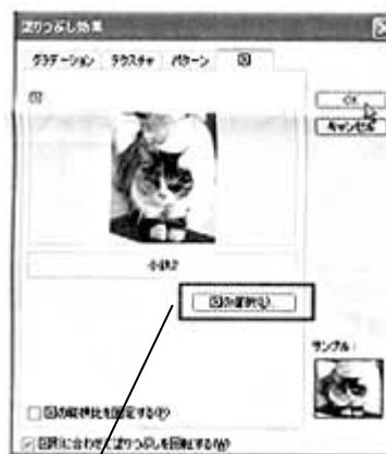
ここをクリックして、写真ファイル を指定すると、図欄に画像とファイル 名が表示される

フリーフォームが指定した写真で塗りつぶされる、枠線の色を「なし」にすれば、切り抜いた写真に見える！