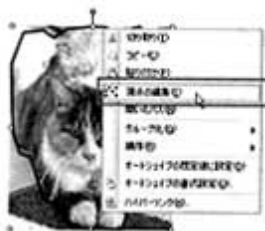
塗りつぶしの色を「なし」 にして枠線を太くした