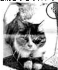
フリーフォームで だいたいの輪郭を描く