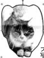
フリーフォームが 写真で塗りつぶされた