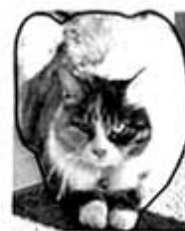
線をなめらかにした